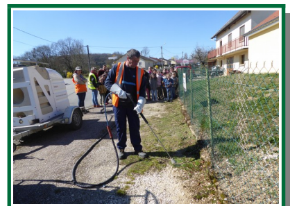
Désherbage à la vapeur d'eau.

Désherbage à l'aide d'un réciprocatrice (2 lames tournant en sens inverse pour éviter les projections de cailloux).