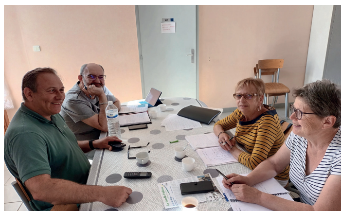
La Commission Communication au travail !